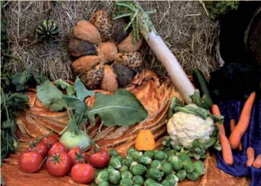
Zum Erntedankfest zeigt der Garten sich von seiner schönsten Seite

Manches Gemüse ist eigentlich Obst. Man nennt es auch „Fruchtgemüse“, weil es sich dabei um die Früchte einer Pflanze handelt. Das kann man ganz einfach daran erkennen, daß dieses Gemüse Kerne enthält, die ja die Samen der Pflanze darstellen und aus denen neue Pflanzen wachsen können. Zum Fruchtgemüse gehören zum Beispiel Tomaten, Kürbisse, Zuc-