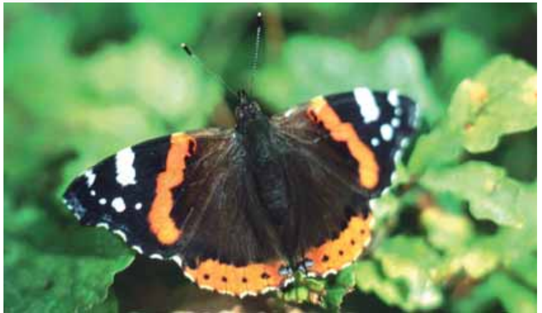
Fliegt über die Alpen: Schmetterling Admiral

Freilich gelingt es bei weitem nicht allen, die Alpenkette zu überqueren und das rettende Südeuropa zwecks Überwinterung zu erreichen. Eine Grundvoraussetzung ist dabei der ausreichende Nahrungsaufnahme, da der lange Flug