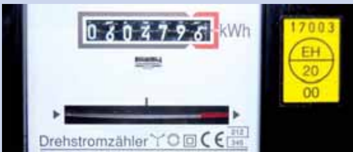
Explodierende Nebenkosten: „Stimmt etwa der Zähler nicht?“