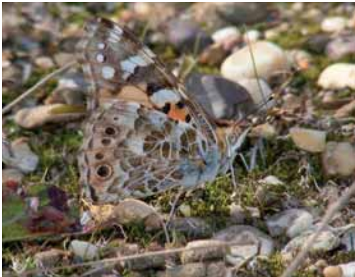
Die Unterseite des Distelfalters ist gut getarnt

jede Menge Energie verbraucht – das haben die kleinen Schmetterlinge in Relation zum Airbus wiederum gemeinsam. Getankt wird auch hier Flüssigtreibstoff, vor allem Nektar und Obstsaft, die zuckerhaltig sind.