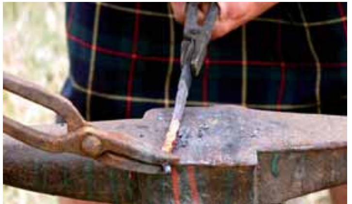
„Man muß das Eisen schmieden, solange es noch heiß ist“

Auch aus anderen Zünften sind uns Sprichwörter und Redewendungen bekannt. Gerade beim Handwerk drückt sich in vielen Formulierungen einerseits das hohe Ansehen des Meisters und/oder des Gesellen aus, andererseits