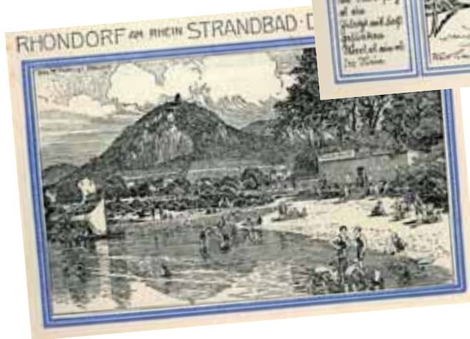
Das Rhöndorfer Strandbad zeigt die Rückseite dieses Notgeldscheines

Selbst Kleinstädte, wie das Örtchen Sternberg im heutigen Mecklenburg-Vorpommern, druckten nach Ende des Ersten Weltkrieges Geldscheine. Im Falle Sternbergs erschienen Noten, auf denen eine Hostienschändung durch Juden zu sehen war, die sich angeblich im Jahre 1492 ereignet haben soll. Das Brückenhofmuseum in Königswinter-Oberdollendorf zeigt der-