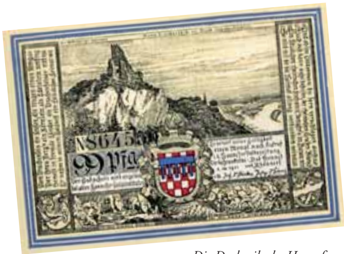
Die Dachzeile des Honnefer Notgeldes bezieht sich jeweils auf eine der Fragen der sieben Zwerge