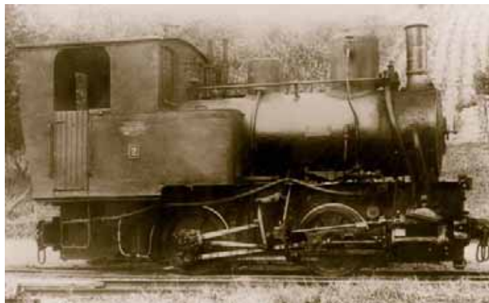
Das hier ist „Marie“, die bei der HTB lange Zeit ihren Dienst versah