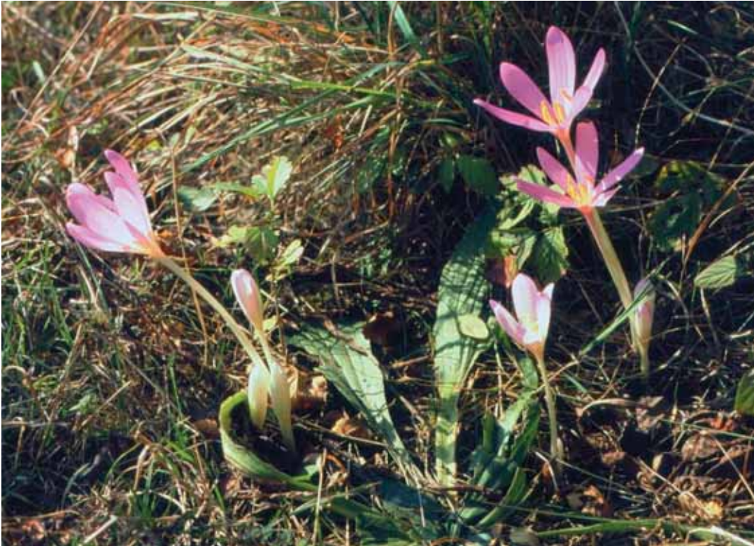
Im Siebengebirge ist die Herbstzeitlose eher selten zu finden

das Gift spezifisch die Zellteilung bzw. die Regeneration von Zellen verhindert, kann es gezielt eingesetzt werden, um Mutationen aufzulösen. Die dadurch bewirkten genetischen Veränderungen – es kommt zu einer Vervielfachung der Chromosomensätze – ermöglichen es, beispielsweise neue Nutzpflanzensorten zu erzeugen. Eines bliebe noch zu klären: