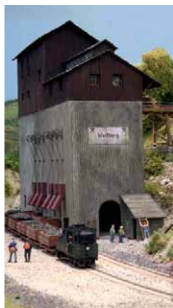
Dieses Modell der Brecheranlage am Weilberg ist im Brückenhofmuseum Oberdollendorf zu sehen

1930 kam es zur Stilllegung des Personenverkehrs. Zwei Jahre später folgte die Stilllegung des Steinbruchs am Großen Scharfenberg: Nun gab es auf der Strecke zwischen Limperichsberg und Grogelsbitze gar keinen Verkehr mehr. Dies führte 1937 zum Abbau der Gleise.