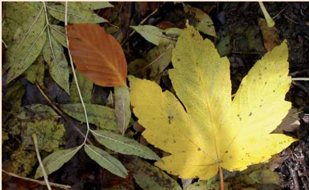
Gepreßt eine tolle Grundlage für herbstliche Collagen: Ahornblätter

Bei uns in Deutschland wachsen im Wald drei verschiedene Ahornarten: der Bergahorn, der Spitzahorn und der Feldahorn. Man kann sie gut an ihren Blättern unterscheiden, doch alle drei haben fünfblappige Blätter, die ein bißchen wie fünf Finger einer Hand aussehen. Alle blühen zwischen April und Mai – dann