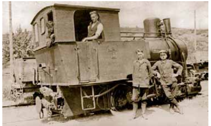
Lok „Willy“ mit Personal an der Werkstatt in Oberdollendorf

Bereits ein Jahr später übernahm die Bröltaler Eisenbahn AG (BTE) die Betriebsführung der HTB. Die Bröltalbahn befuhr ebenfalls Strecken im Siebengebirge – ein direkter Konkurrent der Heisterbacher Talbahn. Die Aktienmehrheit an der BTE hatte damals die Basalt AG Linz.