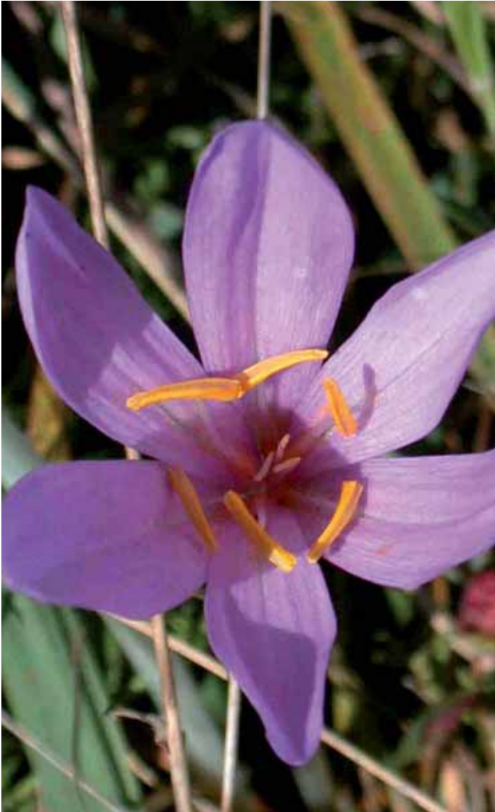
Schon in der Antike bekannt: Herbstzeitlose

Die deutsche Giftpflanzenliste ordnet die Herbstzeitlose folgerichtig als „sehr stark giftig“ ein. Insofern ist der Volksname „Wiesensafran“, wegen der auffallend großen gelben Pollensäcke, sehr irreführend. Da sind Bezeichnungen wie Giftkrokus, Hennengift oder Teufelsbrot schon treffender. Tückisch ist, daß Ziegen und Schafe, ohne selbst auffällig zu sein, aufgenommenes Colchizin über die Milch abgeben und somit indirekt Menschen vergiften können.