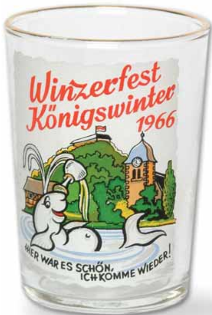
Ein Prosit auf »Moby Dick«

Vor dem Morgengrauen passierte er am 30. Mai erneut Rees rheinaufwärts. Inzwischen war seine weiße Haut von der trüben Rheinbrühe und Öl deutlich gekennzeichnet. Zudem hatte er ordentlich an Gewicht verloren. In den schmutzigen Fluten des Rheins, mit Phosphaten, Schwer-