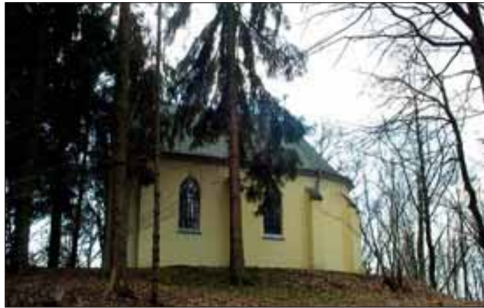
Blick von Hohenhonnef kommend: Verwünschter Ort im Nadelwald

immer ein paar frische Blumen. Zur Ausstattung gehören auch Kreuzwegtafeln der Berliner Bildhauerin Margarete Bröcker (1929/30) an den Seitenwänden. Eine hölzerne Gedenktafel erin-