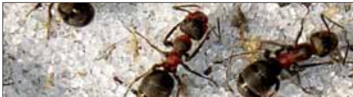
Emsig bei der Arbeit: Rote Waldameisen

seräumen – und die Heimat von bis zu einer Million Ameisen. Könntet Ihr durch eine Glasplatte hineinschauen, wäret Ihr bestimmt ganz erstaunt von dem fleißigen Gewimmel, das dort