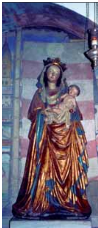
St. Maria im Kapitol (Köln)