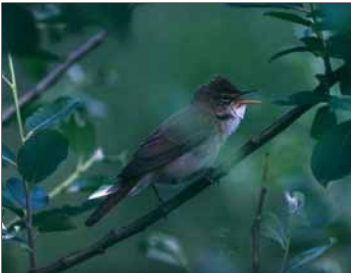
Begnadeter Stimmenimitator: Der Sumpfrohrsänger

Der geschwätzige kleine Vogel, um den es sich diesmal handelt, hat viele Namen und Eigentümlichkeiten. Aber hauptsächlich ist er meist ein unsichtbares, teils unergründliches Phänomen, sowohl für das Publikum, das seinen Gesang bewundert, als auch für Forscher, die verzweifelt versuchen, sein Genie vom wahren Ich zu trennen. Die Rede ist vom Sumpfrohrsänger.