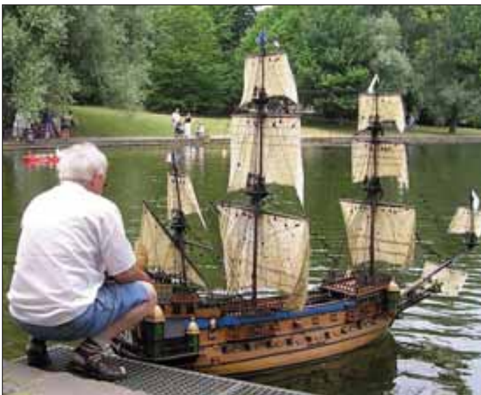
Auch diese wunderschöne Dreimastgaleone, die »La Couronne«, wird in Unkel zu bewundern sein

Schnittige Rennboote pflügen pfeilschnell durch das Wasser, das luxuriöse Kreuzfahrtschiff »Hanseatic« liegt gelassen vor Anker, bullige Schlepper und hochaufragende Containerschiffe, ja sogar U-Boote, bereichern im romantischen Rotweinstädtchen Unkel das maritime Bild. Was wie eine utopische Schilderung anmutet, wird in wenigen Tagen Wirklichkeit, wenn am 6. und 7. Mai 2006 im Freibad Unkel das »Schiffsmodell-Schaufahren« des SMC Unkel startet.