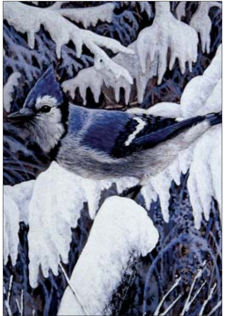
Jetzt erst sind die Vögel auf Eure Hilfe angewiesen!

Doch das Salz darin schadet Euren gefiederten Freunden – erst Recht im Winter, wenn Teiche und Pfützen zugefroren sind und die Tiere ihren Durst nicht stillen können. Besser, man kauft geeignetes Vogelfutter oder mischt selber ein paar Leckerbissen zusammen – am besten für jeden Vogel etwas. Amseln zum Beispiel lieben Äpfel und in Fett getränkte Körner und Sonnenblumenkerne . Auch Rosinen gehören zu ihren Leib- und Magenspeisen. Meisen lieben – wie der Name schon sagt – weiche Meisenknödel , aber auch Erdnüsse und andere Nußarten. Al-