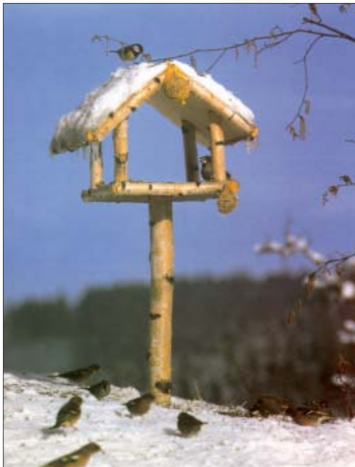
So ist es richtig: Der Futterplatz ist freistehend, überdacht und nicht zu dicht am Boden