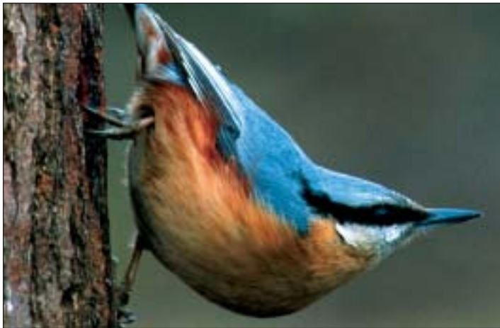
Vogel des Jahres 2006: der Kleiber

Akrobaten zeigen ihre Kunststückchen am Boden, die Luftakrobaten führen sie am Himmel vor – und dazwischen? Da gibt's nichts, oder? Doch, den Kleiber! Im Zirkus der heimischen Natur, in der Gilde der wuseligen Kleinvögel, unter dem Zelt Dach der Baumkronen in Wäldern und Parks, führt er seine Tricks und Verrenkungen auf. Die Baumstämme sind seine Manege. Wie in manch echtem Zirkus fehlt derzeit etwas das Publikum, das dies zu würdigen weiß. Vielleicht wurde auch deshalb dieser einheimische Singvogel vom Naturschutzbund Deutschland zum »Vogel des Jahres 2006« gewählt, eine Kampagne, die den Blick auf die strapazierte Natur und die Vielzahl unterschiedlichster einheimischer Vogelarten lenken möchte.