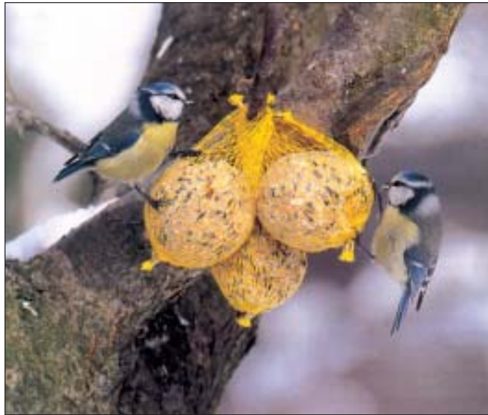
Zwei Blaumeisen tun sich an einem Bündel Meisenknödel gütlich

lerdings solltet Ihr den Vögeln nur ungesalzene Nüsse aus der Tierhandlung geben. Haselnüsse und Walnüsse müßt Ihr zudem vorher knacken! Damit macht Ihr auch Buchfinken und Gimpeln eine Freude. Die possierlichen Singvögel lieben aber auch Hanfsamen und andere ölhaltige Samen. Buntspechte hämmern nicht nur in der warmen Jahreszeit an Baumstämmen, sie picken auch im Winter gern Fett von der Baumrinde ab. Wenn Ihr Vogelfutter selber mischt, könnt Ihr ein wenig von der noch warmen Fettfutter-Masse an einen Baum in Eurem Garten gießen – aber natürlich so hoch, daß keine Katze daran kommt! Wenn Ihr etwas Glück habt, könnt Ihr an einer solchen Fettfutter-Rinde sogar einen Kleiber (siehe Seite 4) beobachten. Eichelhäher tun sich gern an Nüssen, Erdnüssen und Fettfutter gütlich, Kernbeißer be-