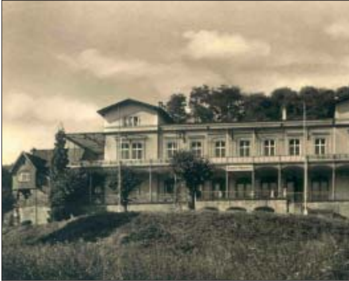
Vor 150 Jahren war hier noch die Endstation

kanzler Fürst Otto von Bismarck. Berühmtheiten wie Victor Hugo, Guillaume Apollinaire, Heinrich Heine, Ludwig Uhland, Karl Simrock, die Gebrüder Jacob und Wilhelm Grimm und viele andere kehrten ein. Johannes Brahms, Clara Schumann und Franz Liszt gaben hier viel bejubelte Konzerte. Mit dem Bau der Eisenbahn kamen auch wohlhabende Kaufleute und Fabrikanten nach Rolandseck und errichteten sich hier einen Sommersitz.