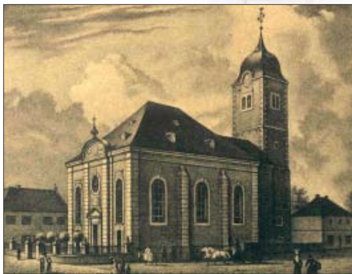
St. Remigius um 1860 (nach August Karstein)

1150 wird erstmals in einer Urkunde eine Königswinterer »Kirche« erwähnt. Bis dahin, zuletzt 1144, ist immer nur von einer Kapelle die Rede. Im Sommer 1780 konnte ein neues Gotteshaus, St. Remigius, seiner Bestimmung übergeben werden.