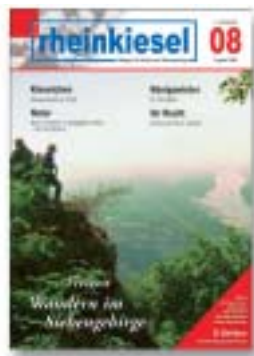
Titelbild: Tourismus Siebengebirge GmbH/Ralf Klodt (Blick auf den sog. Siegfriedfelsen)

Erscheinungsweise: monatlich, jeweils zum Monatsende Redaktions- und Anzeigenschlußtermin: 15. des Vormonats Verteilte Auflage: 15.000 Exemplare Druckunterlagen: nach Absprache (auch als pdf-, eps-, tif- oder jpg-Datei)