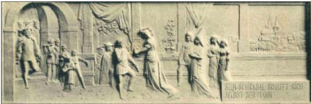
Den Dichter, nicht den Politiker, ehrte das Oberkasseler Denkmal. Das Relief zeigt eine Szene aus »Otto der Schütz«

Als Korrespondent der Augsburger »Allgemeinen Zeitung« verdiente sich Kinkel erste Sporen als Journalist. Zu seiner politischen Einstellung hielt er 1845