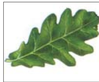
Blatt der Eiche

Den Baum kennt Ihr bestimmt: die Eßkastanie