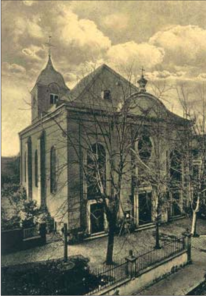
St. Remigius um 1920

ster des bergischen Landes und Amtes Blankenheim Heinrich von Ley verheiratet, und Philipp Heinrich de Claer verfolgten eine andere Linie und klagten. Letztlich gaben die Gerichte der Gemeinde recht. Die Kinder hatten noch überlegt, bis zum Papst zu gehen, um ihre Erbschaft zu bekommen.