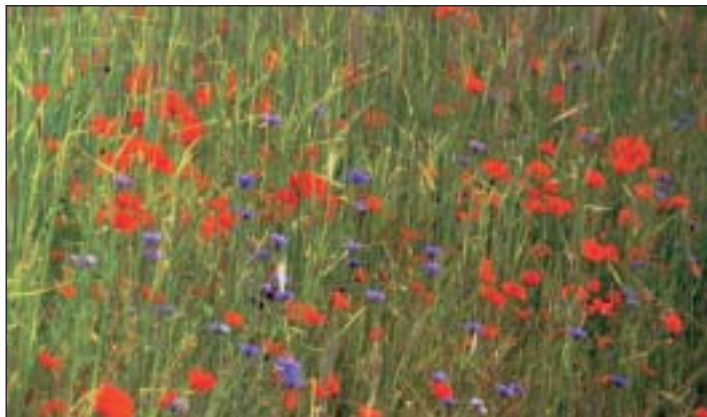
Schmaus für das Auge: Kornblumen im Roggenfeld

cher die Insekten dazu verleitet, die Samen als willkommene Mahlzeit zu verschleppen und damit zur lokalen Verbreitung beizutragen. Kornblumen-Samen, die auf dem Erdboden landen, haben sogar die Fähigkeit, sich als Bodenkriecher davonzumachen und bei Widerstand als »Bohrfrucht« in den Boden zu schrauben. Dies ist möglich durch hygroskopisch reagierende Fruchthaare, die bei zunehmender Austrocknung Spreizbewegung zeigen. Also, man merkt: Die Verbreitung der kornblumenblauen Flockenblume funktioniert im Kleinen wie im Großen. Im Rheintal und unmittelbaren Siebengebirgsraum wird der Leser zwar kaum auf natürliche Vorkommen der Pflanzenschönheit stoßen, zu selten ist sie in dieser Region.