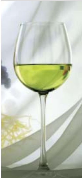
Jeder Wein hat »seine« Farbe: hier der Kerner

Im letzten Beitrag haben wir uns damit beschäftigt, welche unserer Sinne beim Weingenuß beteiligt sind. Heute geht es darum, wie sich aus der Sinnhaftigkeit unserer Wahrnehmungen ein Urteil über den Wein entwickeln läßt. Wie können wir mit einfachen Erkenntnissen den »Richtigen« für uns finden?