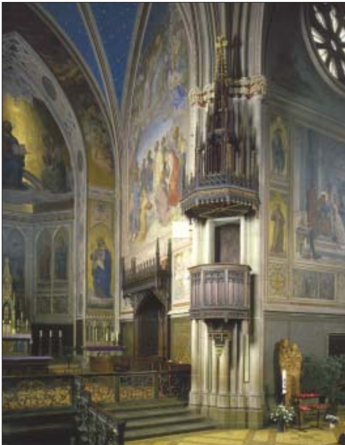
Blick in den Chor und das südliche Querhaus