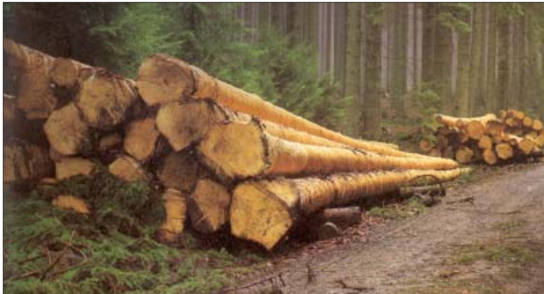
Der Wald dient dem Menschen auch zum Geldverdienen: Holz kann man verkaufen

Bäh, schon wieder Waldspaziergang mit Oma und Opa, wie langweilig? Von wegen! In unserem Wald gibt es eine ganze Menge zu entdecken. Und wer Bäumen ganz genau zuhört und vor allem zuschaut, dem können sie eine Menge erzählen!