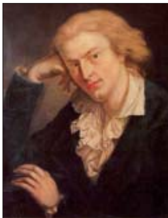
Friedrich von Schiller schildert in seiner berühmten Ballade höchst dramatisch die fürchterlichen Folgen einer Bürgschaft

Solange der Dritte seinen Verpflichtungen nachkommt, hat der Bürge nichts zu befürchten. Kommt es jedoch zu Problemen, zumeist bei der Bedienung der monatlichen Raten, gerät der Bürge in Schwierigkeiten. Dann haftet er mit seinem Vermögen für fremde Schulden. Regelmäßig wird, was nach dem Gesetz zulässig ist, eine Bürgschaft auch für zukünftig noch entstehende, also ungewisse Forderungen abgeschlossen. Auch wenn die Haftung für diese ungewissen Forderungen in der Höhe auf einen bestimmten Betrag begrenzt ist, ging der Bürge bei Abschluß des Bürgschaftsvertrages doch davon aus, daß es schon nicht so weit kommen werde. Zumeist sind die Bürgen mit den Schuldnern persönlich bekannt oder verwandt und schenken deren optimistischen Zukunftsprognosen Glauben. Wenn sich dann die Vermögensverhältnisse des Schuldners verschlechtern, hat der Bürge gegenüber dem Gläu-