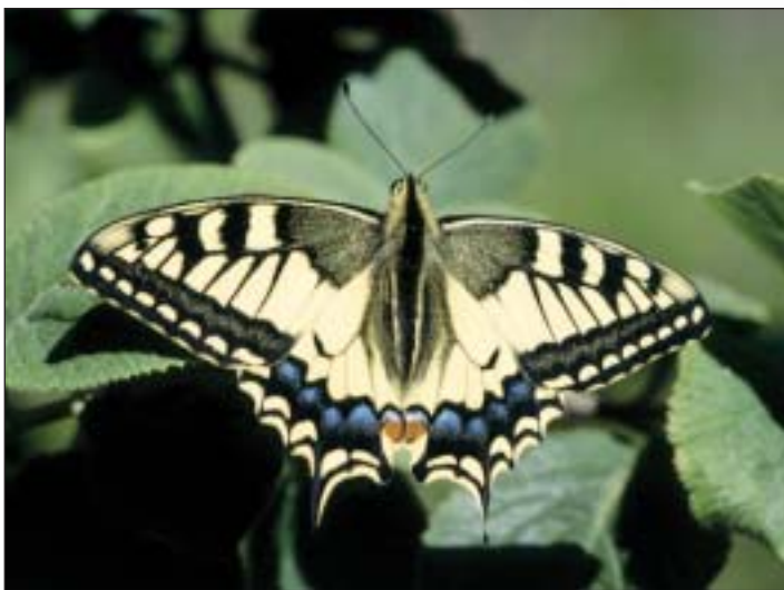
Wunderschöner Edelfalter: der Schwalbenschwanz

Keine Frage: Er zählt zu den schönsten und auffälligsten Tagfaltern unserer Heimat und, wie es sich üblicherweise mit den schönsten Dingen so verhält, gehört er zu den eher seltenen Erscheinungen: der Schwalbenschwanz. Dennoch ist er auch im Siebengebirge zu finden.