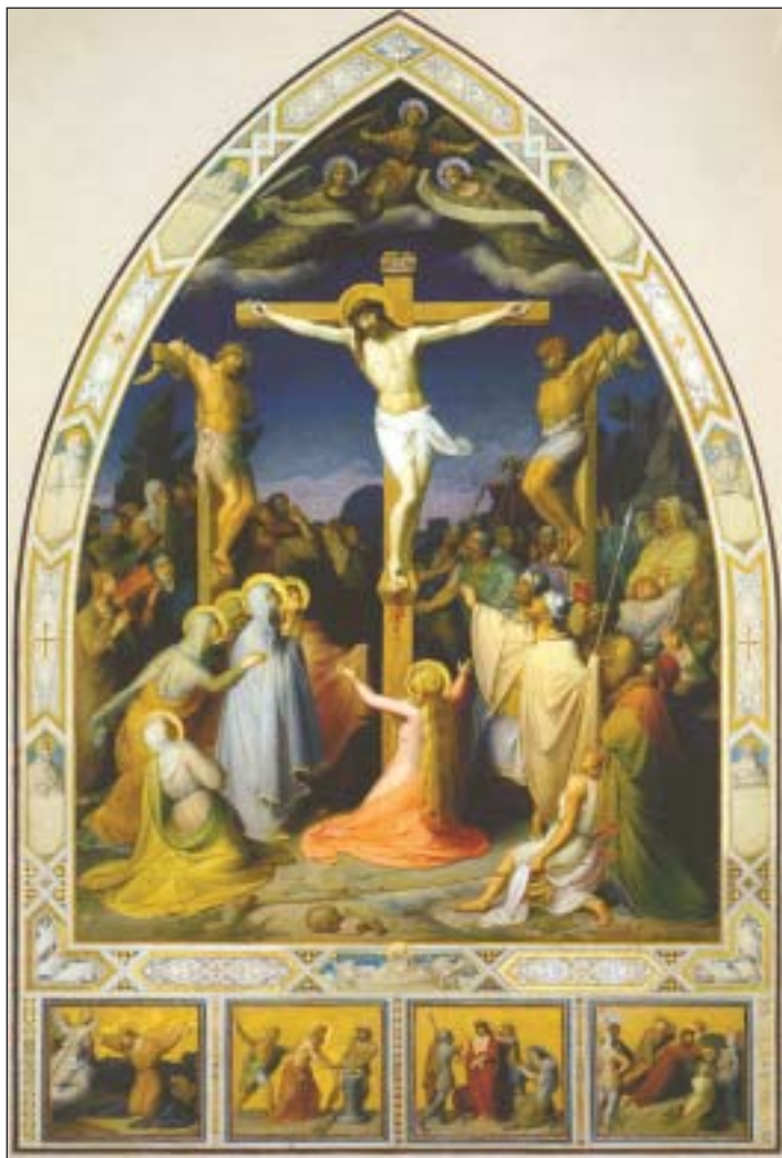
Nordwand des nördlichen Querhauses mit der Kreuzigung

men Lebens und Schaffens auf dem Apollinarisberg wie folgt: »Es folgte nun, nachdem auch Ittenbach und ich unsere dortige Tätigkeit begonnen hatten (1844) eine schöne Zeit gemeinsamen Lebens und Schaffens. Jene glücklichen Tage vom Apollinarisberg sind uns allen in steter freund-