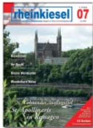
Titelbild: Erwin Bidder (Die Aufnahme zeigt die Wallfahrtskirche St. Apollinaris in Remagen)

Erscheinungsweise: monatlich, jeweils zum Monatsende Redaktions- und Anzeigenschlußtermin: 15. des Vormonats Verteilte Auflage: 15.000 Exemplare Druckunterlagen: nach Absprache (auch als pdf-, eps-, tif- oder jpg-Datei)