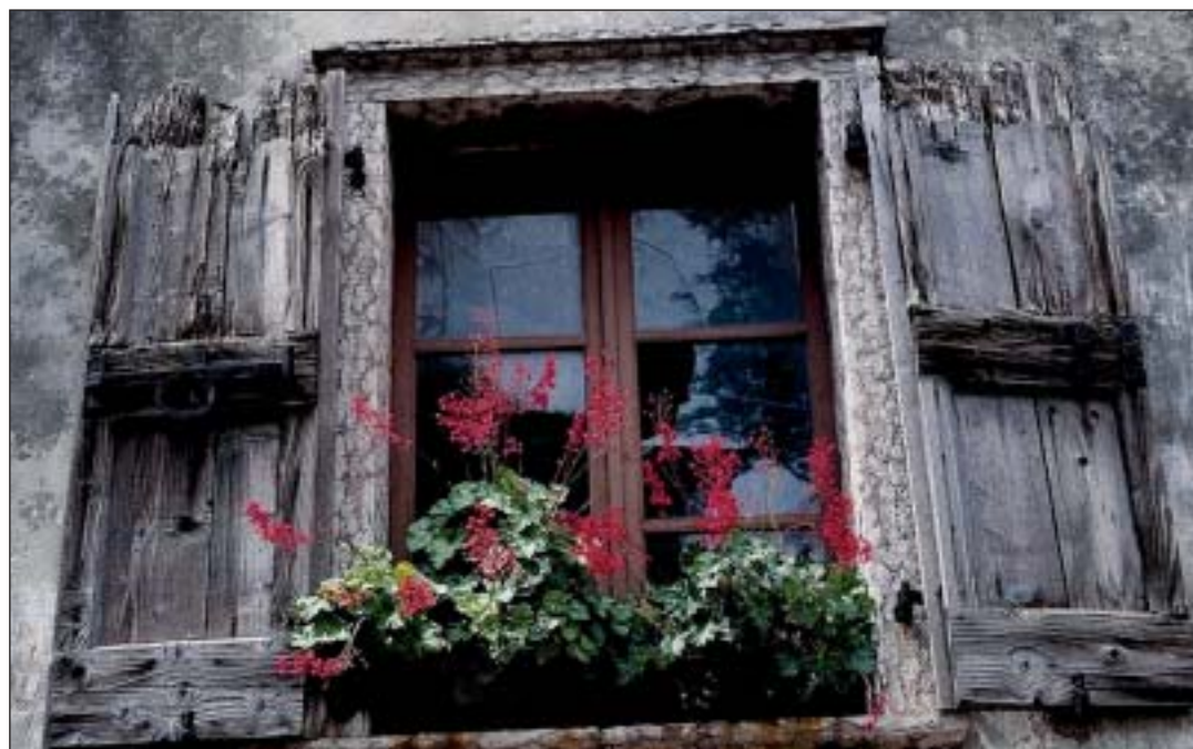
Hier wird kein Mieter die Modernisierung verweigern wollen

oder äußert er sich nicht, muß der Vermieter auf Duldung der Arbeiten klagen. Der Mieter hat Modernisierungsmaßnahmen zu dulden, wenn sie nicht eine Härte für ihn bedeutet, die auch durch die berechtigten Interessen von dem Vermieter oder anderen Mietern nicht zu rechtfertigen sind.