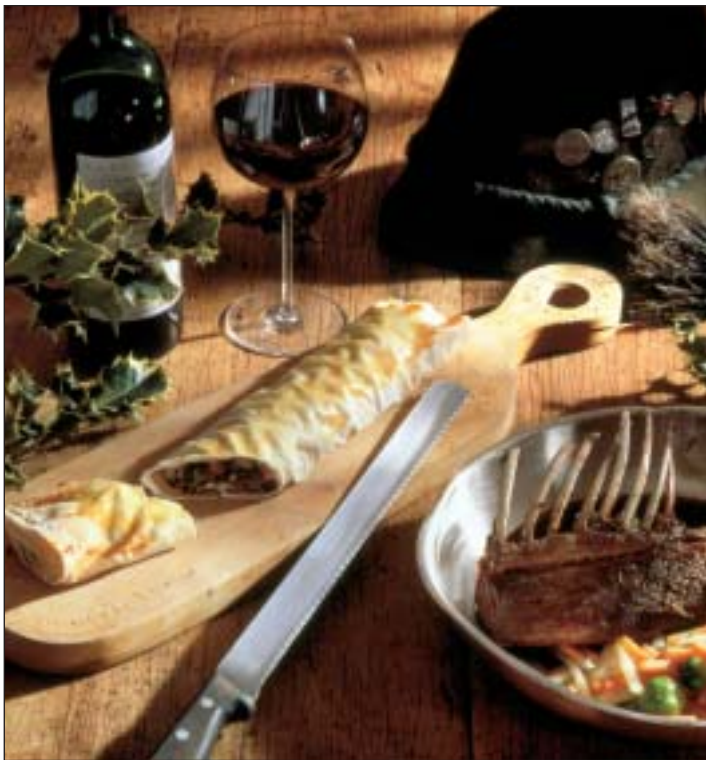
Paßt hervorragend zu Wild: Spätburgunder

Heute möchte ich eine Lanze für die im internationalen Vergleich oft zu Unrecht unterbewerteten deutschen Rotweine brechen. Blauer Spätburgunder, Dornfelder und Blauer Portugieser haben sich im Laufe der Jahre zu wahren Rennern entwickelt.