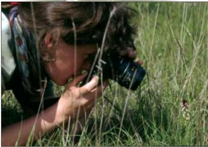
Von den Schwierigkeiten eines Fotografen

Sollten dies die Gründe sein, weshalb das Brandknabenkraut, eine unserer rund 60 heimischen Orchideenarten, sang- und klanglos verschwindet? Um andere seltene Arten, seien es Orchideen wie den Frauenschuh oder Tiere wie den Weißstorch, wird viel mehr »Tamtam« gemacht. Auf die bedrohte Orchideenart und ihr Schicksal machen deshalb die »Arbeitskreise Heimische Orchideen« (AHO) in Deutschland aufmerksam, die die stark bestandsrückläufige Blume zur »Orchidee des Jahres 2005« wählten.