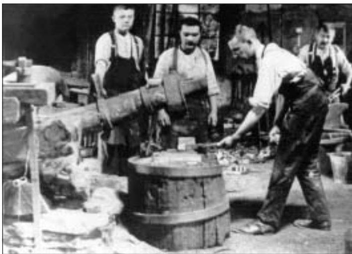
Umweltgerechter Antrieb durch den Breitbach – Blick ins alte Hammerwerk an der Rheinstraße

Trotz seiner aufwendigen Ausbildung war der Tausendsassa bei seinen Kunden nicht gut gelitten. Ob es daran lag, daß ein Sack Korn immer deutlich weniger ergab als einen Sack Mehl? Bei Unzufriedenheit die Mühle zu wechseln, war jedenfalls nicht drin – es herrschte der Mühlzwang: Der Landesherr hatte allein das Recht, Mühlen zu betreiben, Pächter einzusetzen und zu bestimmen, wo seine Untertanen mahlen durften.