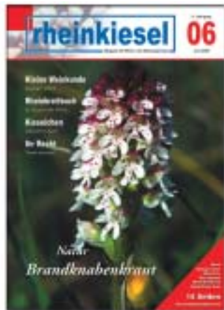
(Die Aufnahme zeigt das Brandknabenkraut)

Erscheinungsweise: monatlich, jeweils zum Monatsende Redaktions- und Anzeigenschlußtermin: 15. des Vormonats Verteilte Auflage: 15.000 Exemplare Druckunterlagen: nach Absprache (auch als pdf-, eps-, tif- oder jpg-Datei)