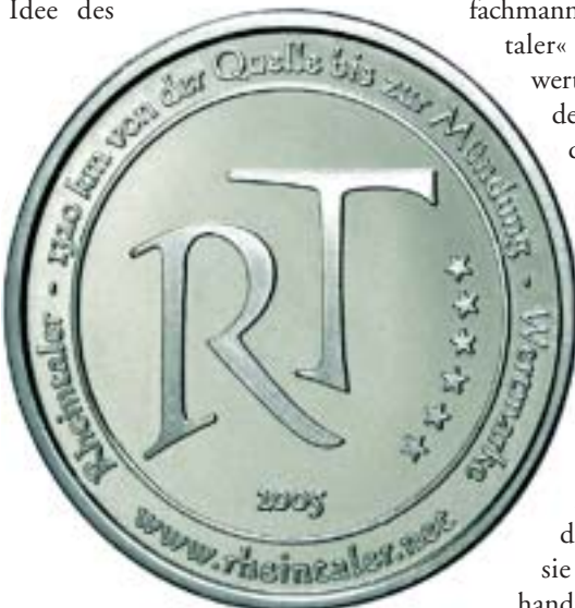
Ansprechendes Design: Rheintaler

Und was das »Wandern« des Talers anbelangt: Das Volkslied scheint an Aktualität absolut nichts eingebüßt zu haben. Tatsächlich ist es ja so: Je mehr der Taler wandert, um so größer ist der Gewinn, den sein Besitzer aus ihm ziehen kann.