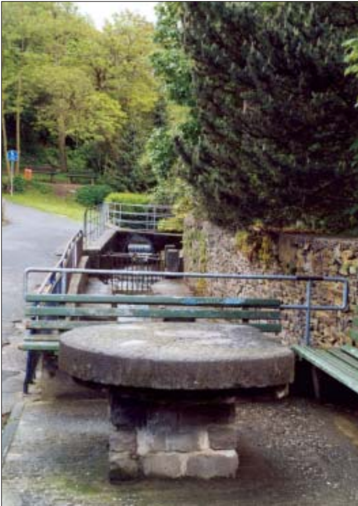
Der Mühlstein dient nun zur Rast: im Hintergrund stand einst die Ölmühle

nennt, erfuhr mehrere Umnutzungen. Zunächst vielleicht als Lohmühle – d.h. zum Zermahlen von Eichenrinde für das Gerben von Leder – errichtet, war sie im 19. Jahrhundert in der topographischen Karte als Schleifmühle eingetragen. Dort trieb das Mühlrad einen Schleifstein zum Schärfen von Klingen u.ä. Metallwerkzeug an. Später wurde der stattliche Bau direkt am Rhein zur Ölmühle umfunktionierte und gegen Ende des 19.