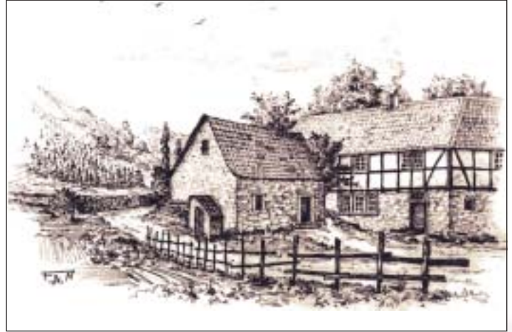
Produzierte vor allem Lampenöl – die alte Ölmühle an der Unteren Burg, Zeichnung von Franz Neunkirchen

Jahrhunderts zur Farbmühle. Mühlräder ächzten am Breitbach jedoch nicht nur zum Mahlen, sondern auch für bergbauliche Zwecke. Noch vor 200 Jahren etwa erhob sich bei der Erzgrube St. Marienberg ein gut 12 Meter hohes Mühlrad einer sogenannten »Kunst« mit Pumpen zum Entwässern der Stollen. Weiter unterhalb, auf der Höhe der heutigen Ziegelei, befand