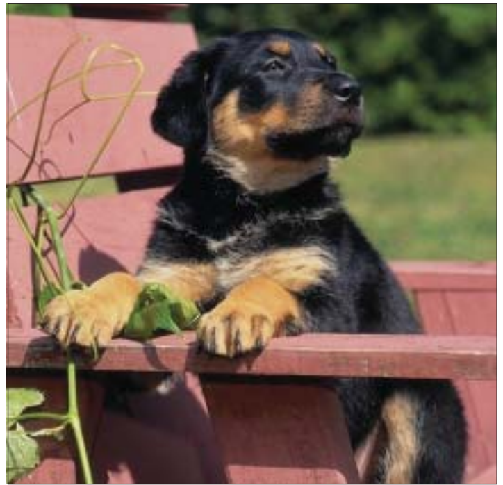
Nanu, warum verhält sich Nachbars »Lumpi« plötzlich so eigenartig? Hat er vielleicht Tollwut?

Aber warum stehen solche Schilder nicht im Siebengebirge? Ganz einfach: Förster impfen die Tiere in deutschen Wäldern nun seit 20 Jahren gegen Wildtollwut. In vielen Regionen ist die Krankheit deshalb schon fast oder ganz verschwunden. In der ganzen Bundesrepublik gab es zuletzt nur 37 Tiere pro Jahr, die an Tollwut erkrankt sind, davon 21 Füchse und ein Reh. In anderen Ländern ist das aber nicht so.