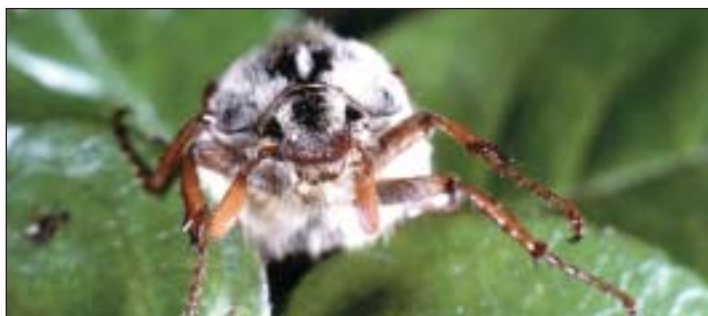
Keine angreifende Bestie, sondern ein schlichter Maikäfer

Erst in der Januar-Ausgabe des rheinkiesel hatten wir eine Ente mit Standheizung und Klimaanlage vorgestellt – in der Rubrik »Natur«, wohlgermerkt. Jetzt präsentieren wir Ihnen einen Käfer, der serienmäßig mit GPS-Navigation ausgestattet ist. Und wiederum halten wir uns an das Original, weil Kopien eben nur Kopien sind. Das bedeutet zwar, daß eingeschworene Automobilfans hier nichts Neues über den heißgeliebten »VW-Käfer« erfahren, wohl aber über das Vorbild aus der Natur inklusive einem Navigationssystem, das – obwohl Jahrtausende alt – kleiner und dabei leistungsfähiger ist als die bisherige Mikrochiptechnologie des Menschen.