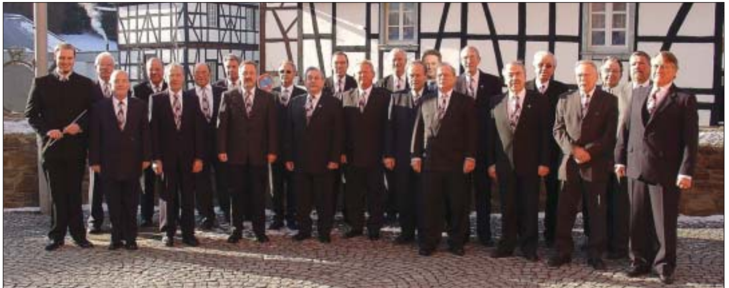
Im Jubeljahr drückt die Sorge um den Chornachwuchs: MGV Cäcilia Bruchhausen

Sequenzen und Litaneien) gepflegt. Als ältestes rheinisches Musikinstrument wurde eine Lyra in einem Grab der fränkischen Zeit unter der Kirche »St. Severin« in Köln gefunden. Außerhalb der Klostermauern lebte uralter Singsang in Zauberversen und Kinderreimen fort, den wir heute noch in Spielliedern klingen hören. Eine kostbare Sammlung von volkstümlichen Liedstrophen hat übrigens Karl der Große anlegen lassen. Sie fiel dem christlichen Eifer seines Nachfolgers zum Opfer. In den folgenden Jahrhunderten blüht der ursprünglich nur psalmodierende Sprechgesang der Gregorianik zu Lied und Hym-