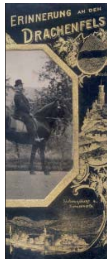
Erinnerungen hoch zu Roß, Ausschnitt (um 1900)

Die ältesten Fotos bestehen aus Blech und sind mit einem kleinen Rahmen und einer Glasplatte darüber gefaßt. Während die Moden wechselten, blieben die Motive fast gleich. Manches Kind lächelte auf einem Esel sitzend und Jahre später wieder als grauhaariger Mann bei seinem »ersten Flug«. Viele der Kulissen-