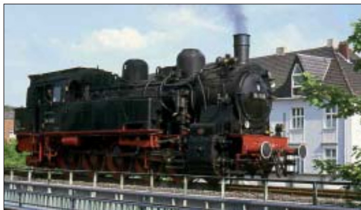
Nostalgisches Vergnügen für Eisenbahnfreunde: Eine Fahrt mit der 94

Einen »Bahn-Wandertag« im Kasbachtal können Familien am 11. und 12. Juni dieses Jahres erleben. An beiden Tagen (siehe Fahrplan) verkehrt eine Dampflokomotive (siehe unser Titelbild) auf der Steilstrecke nach Kalenborn. Die Lok der Baureihe 94 wurde am 27. November 1922 als »8763 Essen« in Dienst gestellt. Einige Maschinen dieser Serie erhielten zusätzlich vom Hersteller, der »Berliner Maschinenfabrik AG, vormals L. Schwartzkopff Berlin-Wildau« speziell für den Dienst auf Steilstrecken zusätzlich die Riggenbach-Gegendruckbremse, so auch die jetzt im Kasbachtal diensttuende Lok. Sie war ursprünglich im Ruhrgebiet und später im Bahnhofsbetrieb Dillenburg eingesetzt. Ihr »zweites Leben« begann im April 1972, als am Bahnhof Gönners als Denkmal aufgestellt wurde. Nach ihrer Restaurierung im