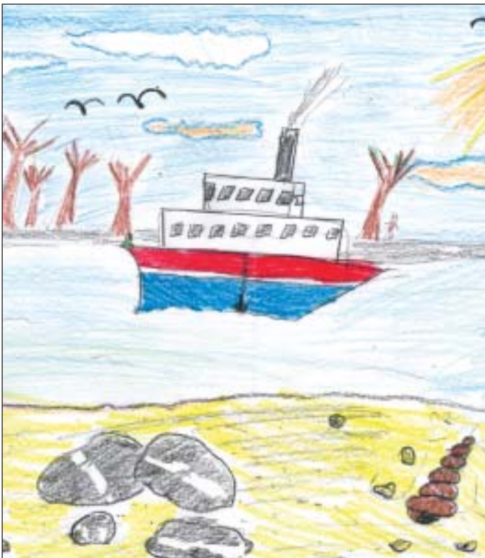
Einfach toll! Stefanie Schröder, Königswinter, 9 Jahre