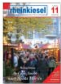
Titelbild: Stadtforum Bad Honnef (Das Foto zeigt den Martinimarkt)

Erscheinungsweise: monatlich, jeweils zum Monatsende Redaktions- und Anzeigenschlußtermin: 15. des Vormonats Verteilte Auflage: 15.000 Exemplare Druckunterlagen: nach Absprache (auch als pdf-, eps-, tif- oder jpg-Datei)