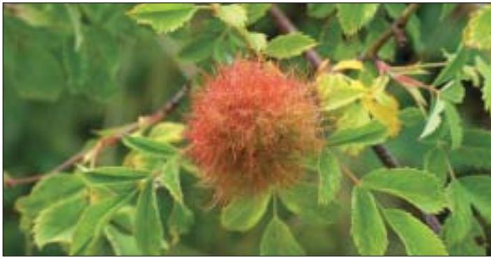
Schön anzusehen: Rosengallen im Sommer

Nanu! – Hat man denn so was schon gehört? Doch Tatsache ist: In der Natur gibt es kaum etwas, was es nicht gibt. Und so können Bäume, aber auch Sträucher und zahlreiche andere Pflanzenarten Gallenprobleme haben, die aber keineswegs vergleichbar mit den Erkrankungen beim Menschen sind. Überdies sind sie für die Pflanzen eher harmlos. Da die wenigsten davon gehört haben dürften, daß Bäume etwas an der Galle haben oder überhaupt solche besitzen können, soll zunächst einmal geklärt werden, um was es sich eigentlich handelt und wie diese Merkwürdigkeit entsteht.