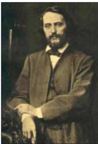
Künstler in Pose: Franz Ittenbach (Gemälde von H. Sinkel)

Bei einem Gang durch Königswinter hasten wir oftmals achtlos durch die Gassen und Straßen. Etliche Straßenschilder erinnern an mehr oder weniger bekannte Persönlichkeiten. Namen wie die Wolfgang-Müller-Straße und der Franz-Ittenbach-Platz weisen auf überregional bekannte lokale Größen hin. Ob die Wahl einer mehr oder weniger versteckten Sackgasse und eines kümmerlichen Plätzchens den Verdiensten dieser beiden Männer gerecht wird, bleibt fraglich.