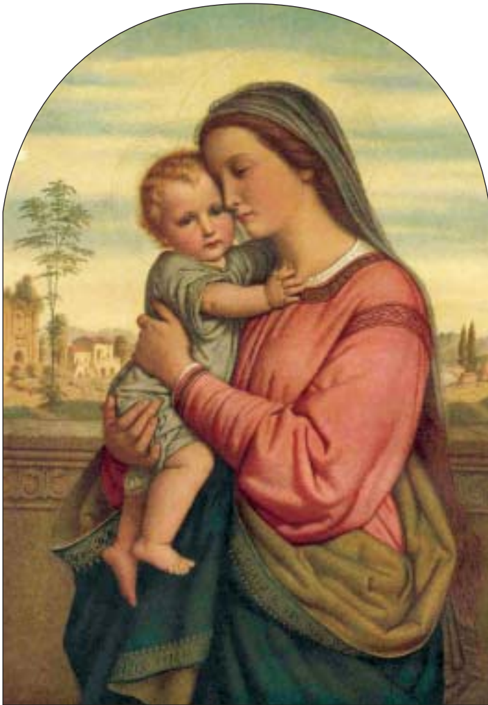
Innigkeit im Ausdruck: »Mater Christi« von Franz Ittenbach

Von 1849 bis 1865 unterrichtete Ittenbach in der Meisterklasse der Düsseldorfer Kunstakademie. In diesen Jahren entstanden fast ausschließlich religiöse Bilder, wie Altarfresken für St. Quirin in Neuss und Altartafeln für Kirchen in Breslau, Königswinter, Düsseldorf und Bonn.