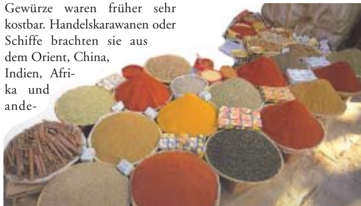
Orientalische Vielfalt: Gewürzbasar in Marokko

Gewürze waren früher sehr kostbar. Handelskarawanen oder Schiffe brachten sie aus dem Orient, China, Indien, Afrika und ande-