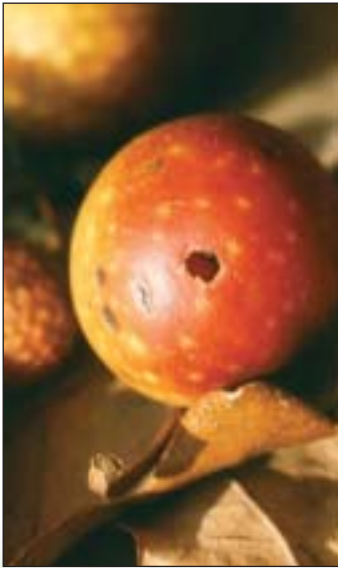
Eichengallen im Herbstlaub

relativ häufigen, grün oder rot gefärbten Beutelgallen an Buchenblättern gehen auf die Buchengallmücke zurück. Die bunten Eichengalläpfel wiederum, die sich stets auf der Blattunterseite befinden und nur eine Kammer aufweisen, stammen von der Gewöhnlichen Eichengallwespe. Ein kleines Loch in der Hülle zeugt vom Schlupf der im Herbst oder Winter ausfliegenden, ebenfalls etwa 4 mm großen Wespe. Sie muß sich mit ihren Mundwerkzeugen einen Weg nach draußen durch die verholzte Außenwand bohren. Die Vielfalt der Gallen und ihrer Verursacher ist beeindruckend (allein bei der Eiche sind mehr als 100 verschiedene Gallsorten bekannt geworden!) und zeugt vom evolutiven Erfolg der Strategie, andere für sich arbeiten und sorgen zu lassen.