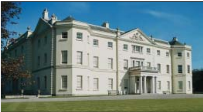
Träume werden wahr: Die unverhoffte Erbschaft macht es möglich

Obwohl große Mengen von Geld- und Sachwerten im In- und Ausland deponiert sind, machen sich deren Eigentümer häufig keine Gedanken darüber, was damit geschehen soll, wenn sie sterben sollten. So kommt es zu Verzögerungen bei der Nachlaßabwicklung, es wird vermeidbarer Ärger heraufbeschworen und dem Fiskus Erbschaftssteuer geschenkt.