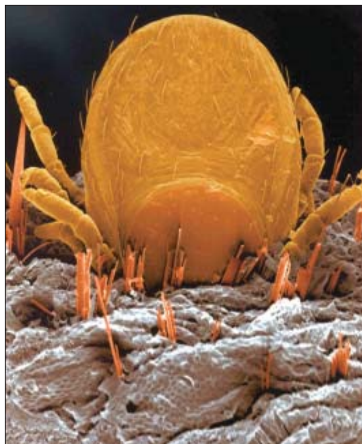
In der Vergrößerung geradezu furchterregend: Saugende Zecke

getiere, zum Beispiel von Mäusen, die über das Laub huschen, auf dem die Larven liegen und auf ihre Opfer warten. Haben sie sich vollgesogen, fallen sie zurück ins Laub und häuten sich zur sogenannten Nymphe.