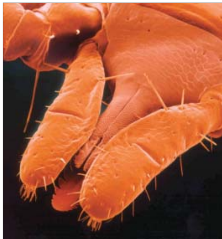
Der Zeckenbiß ist eigentlich ein Zeckenstich. Detail der Saugwerkzeuge.

Zeckenlarven werden meist kaum als einen halben Millimeter groß, mit bloßem Auge kann man sie kaum erkennen. Die Winzlinge bevorzugen das Blut kleiner Na-