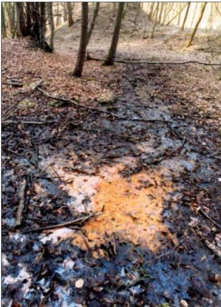
In unmittelbarer Nähe eines verschütteten Stollens der Grube »Alter Fritz« im Schmelztal sickert eisenoxydhaltiges Wasser aus

Erzbergbau im Siebengebirge? Und sogar Kinderarbeit? Manchen mag die Frage erstaunen. Im letzten Teil unserer kleinen Serie über die zahlreichen Gruben im Siebengebirge gehen wir auf die bedrückende Situation der Arbeiterschaft und die wirtschaftlichen Aspekte ein.