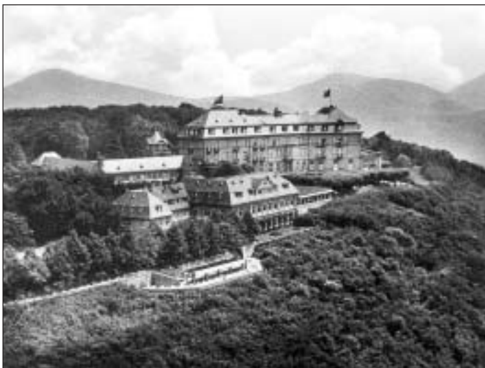
Hoch droben auf dem Berg: Das »Kurhotel Petersberg mit Rheinterrasse«

Keine markante Burgsilhouette ziert sein Gebirgsplateau und an seinen Flanken fehlen schroffe Felssporne wie beim sagenumwobenen Drachenfels – dennoch blickt der 331 Meter hohe Petersberg auf eine bewegte Geschichte zurück und gehört zu Recht zu den bekanntesten der sieben Berge. In der Öffentlichkeit ist der Berg heute nahtlos mit dem Nobelhotel gleichen Namens verbunden.