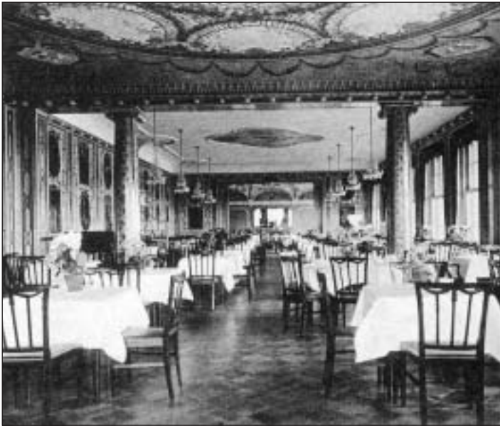
Feudal: Blick ins Restaurant