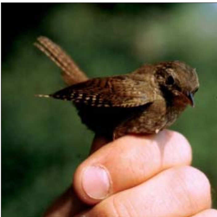
Eine Handvoll Vogel: der Zaunkönig

Der Name »Winterkönig« hingegen dürfte darauf zurückzuführen sein, daß die winzigen Sänger selbst im Winter ihren Gesang erschallen lassen. Während andere Singvögel, sofern sie im Winter überhaupt bei uns bleiben, eher den Schnabel halten, kann es an einem sonnigen Tag in voller Lautstärke aus dem Gehölz schmettern. Wenn etwas königlich am Zaunkönig ist, dann bestimmt der Gesang. Die Strophen sind ungewöhnlich lang, können bis zu zehn Sekun-