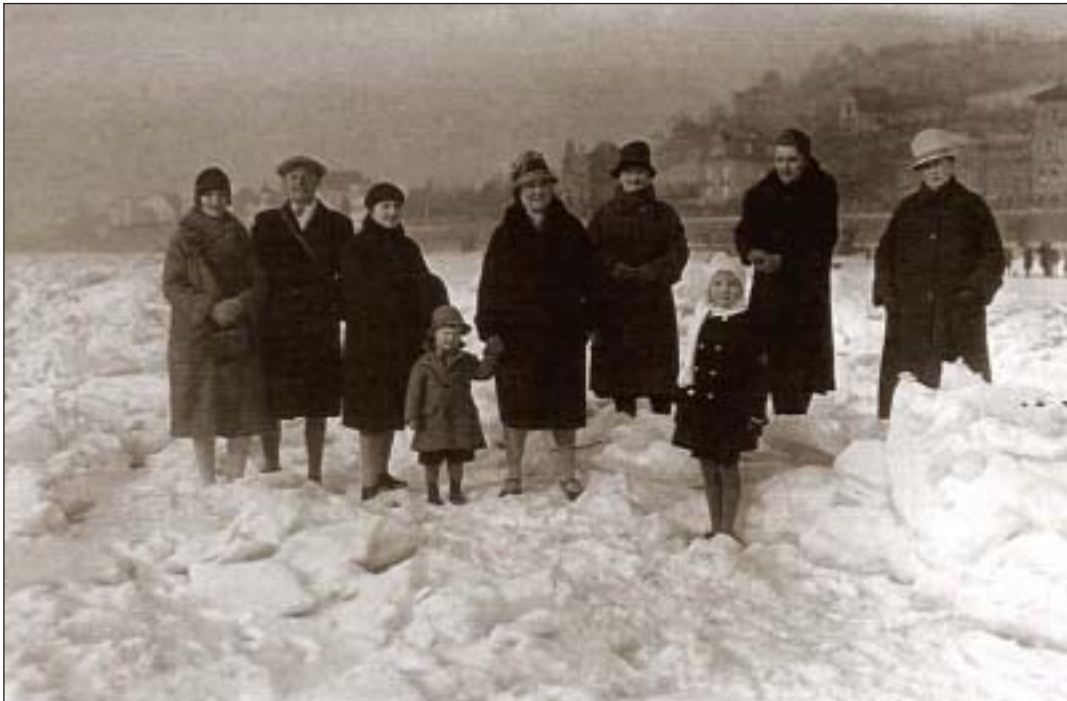
Eismassen am Fuß des Drachenfels im Februar 1929

Eine weitere Proviantaufnahme in Bonn scheiterte. Die Schnur, an der eine Flasche Schnaps von der Rheinbrücke herabgelassen wurde, war zu kurz. Dramatisch wurde die Situation bei Wesseling. Das inzwischen erheblich zusammengeschmolzene »Floß« kam durch die Wellen einen großen Raddampfers bedrohlich ins Schaukeln. Bis zu den Knöcheln standen die Passagiere jetzt im eisigen Wasser. Kurz vor sieben Uhr abends endete das frostige