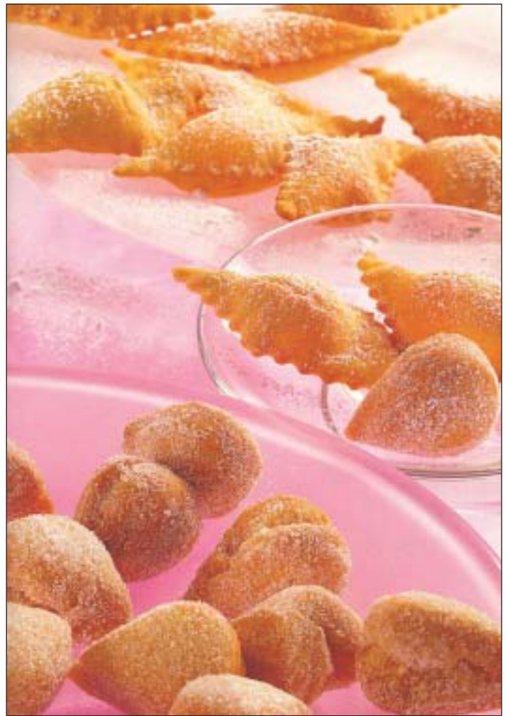
Zucker und Fett – das sind die beiden Hauptzutaten für Muzen

delchen werden mancherorts kleine Muzen genannt, die in Mandelform gebacken werden. In einigen Kochbüchern heißt es auch, daß Mandeln und Marzipan im Teig den Muzemändelchen ihren Namen gaben. Aber das ist noch nicht alles, auch Krapfen (»Ballebüskes«) und Berliner gehören zu den fettigen Köstlichkeiten, die viele Rheinländer an den tollen Tagen knabbern. Aber warum knabbern wir ausgerechnet an Karneval so fettreiches Gebäck? Mancherorts wird Wieverfastelovend auch der »fette« oder »schmutzige« Donnerstag genannt. »Schmutzig« kommt dabei zumindest in der rheinischen Tradition von »schmalzig«. »Historischen Überlieferungen zufolge wurde früher an diesem Tag letztmals vor dem Aschermittwoch geschlachtet«, berichtet Heizmann. Aber wo geschlachtet wurde, gab es jede Menge frisches Fett – und das