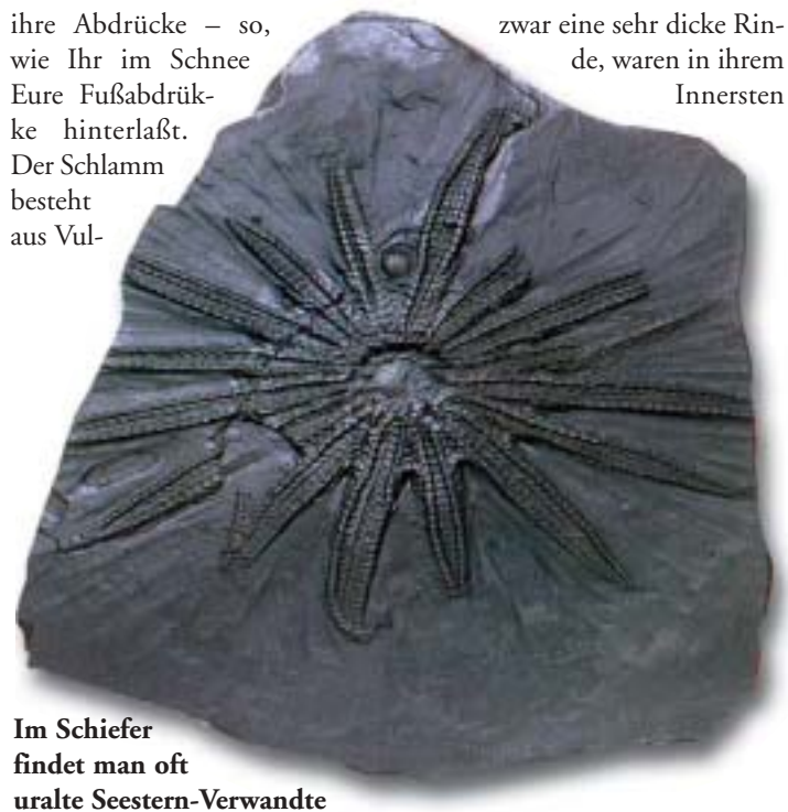
Im Schiefer findet man oft uralte Seestern-Verwandte

Viele der Bäume damals hatten zwar eine sehr dicke Rinde, waren in ihrem Innersten