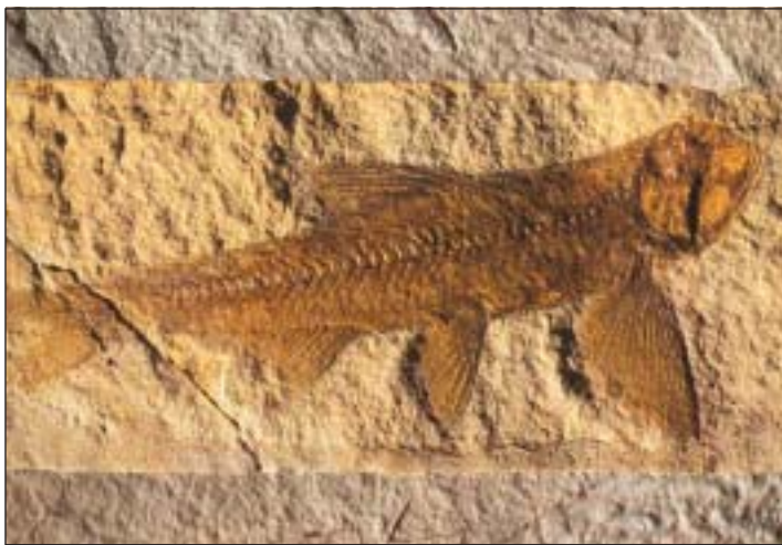
Wo Fischfossilien auftauchen, muß früher Wasser gewesen sein

In zahlreichen Monumentalfilmen stapfen sie eindrucksvoll über die Erde: Dinosaurier, die längst ausgestorbenen Riesen. Aber Dinos sind längst nicht alles, was die Urzeit zu bieten hat.