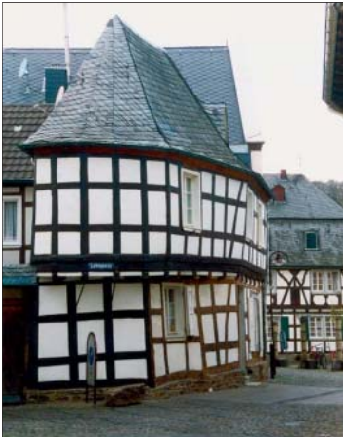
Das Bügeleisenhaus: Fachwerk mit Bruchsteinsockel und Schieferdach

dem Siebengebirge (vermutlich von der Wolkenburg; charakteristisch hierfür ist die stärkere Einfärbung und die sehr gleichmäßige Struktur der Hornblendenadeln im Vergleich zum Stenzelberglatit).