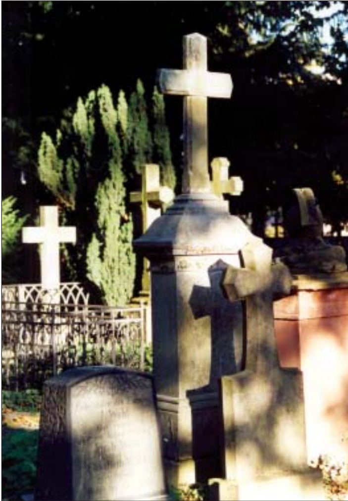
Eine Oase der Ruhe mitten in der Stadt

ein. Ein kleiner Friedhofsführer (siehe Kasten), der interessierten Besuchern Auskunft über den Alten Friedhof gibt, verrät, daß die Grabmäler der Bestatteten »neogotisch« und »antikisiert« sind. Schmetterlinge auf Denkmälern und Steinen symbolisieren die davonschwebende Seele, Fackeln sind Sinnbild für das verlöschende Leben, Baumstümpfe und abgebrochene Säulen deuten auf ein zu früh beendetes Leben hin. Rankt sich Mohn, der als Schlafmittel galt, an einem Grabkreuz empor, zeigt das einen Wandel in der Betrachtung des Todes an: Es ist nicht mehr der vermummte Sensemann, sondern Schlafes Bruder. Ein friedliches Bild, das auch die Lebenden tröstet. Vielleicht strahlt die alte Bestattungsstätte in Bonn deshalb so viel Ruhe aus?