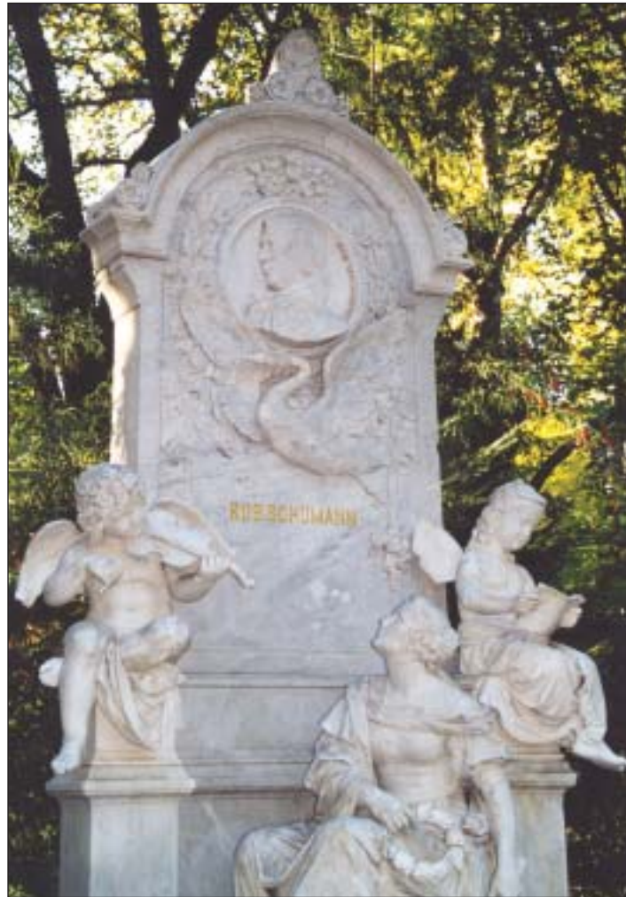
Das Grab des berühmten Komponisten Robert Schumann

len würden. Eben das ist es wohl, was es so reizvoll macht, ihnen nachzuspüren. Sie haben erlebt, was heute nur noch aus Geschichtsbüchern zu erfahren ist. Arndt beispielsweise, der ein erbitterter Feind Napoleons war; Napoleon, diese Romanfigur, dessen Liebe zu Joséphine das