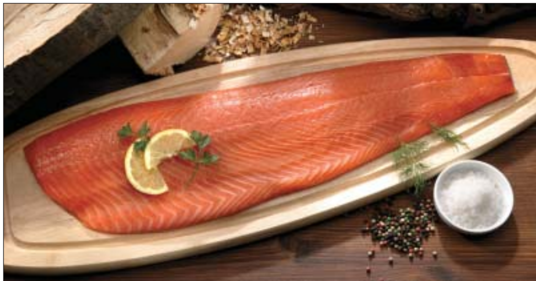
Verlockende Delikatesse: Frischer Lachs