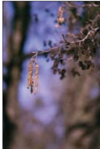
Jetzt schlummern die Blüten fürs nächste Jahr

Die Probleme die dem Baum derzeit zu schaffen machen, sind ganz anderer Art. Seit 1993 stellt man in Deutschland ein Erlensterben fest. Grund ist ein neuartiger Baumpilz, der sich über das Wasser ausbreitet und durch die Rinde in der Nähe der Wurzelregion in den Stamm eindringt.