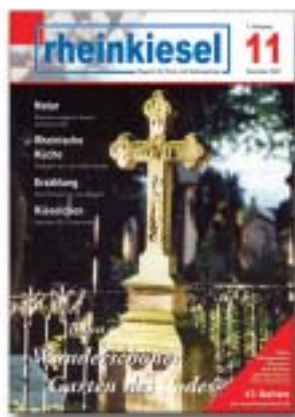
Titelbild: Erwin Bidder (Die Aufnahme zeigt den Alten Friedhof in Bonn)

Erscheinungsweise: monatlich, jeweils zum Monatsende Redaktions- und Anzeigenschlußtermin: 15. des Vormonats Verteilte Auflage: 15.000 Exemplare Druckunterlagen: nach Absprache (auch als pdf-, eps-, tif- oder jpg-Datei)