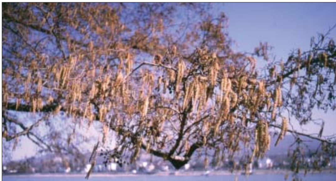
Schwarzerlen prägen das Uferbild am Rhein

Das Jahr neigt sich dem Ende zu. Höchste Zeit, den »Baum des Jahres 2003« zu porträtieren: die Schwarzerle. Dabei eignet sich der November besonders gut, um diese Birkenverwandte bei einem Spaziergang am Rheinufer zu entdecken: Die Schwarzerle erkennt man hervorragend auch ohne Laub. Wie kann das sein? Erkennt man doch Sträucher und Bäume sonst nicht am besten im belaubten Zustand!?