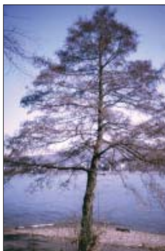
Ohne Laub kann man die Erle schnell erkennen

Zapfen sind die Überreste des nun fast vergangenen Jahres, in dessen Laufe sie ausreifen, verholzten und die kleinen, schmal geflügelten Samen als Flugnüsschen freigaben. Die langen Kätz-