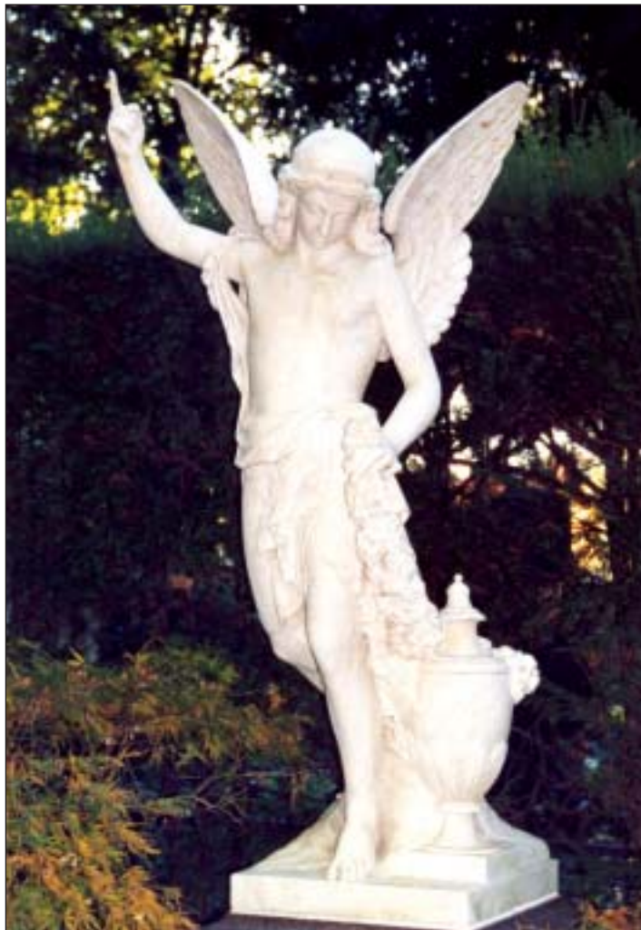
Himmlische Gestalten spenden den Lebenden Trost

Folgt man dem von zierlichen Eisenkreuzen und marmornen