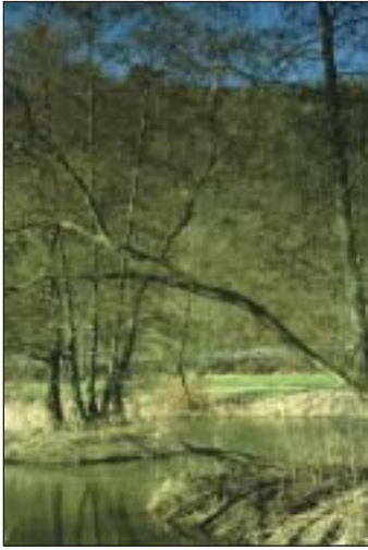
Schwarzerlen säumen naturbelassene Fluß- und Bachufer