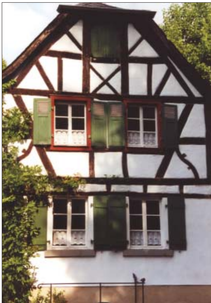
Die Römlinghovener sind stolz auf »ihren« schmucken Winzerhof