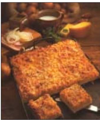
Zum Reinbeißen lecker: frischer Zwiebelkuchen

»Himmel und Äad«, die berühmte Erbsensuppe, der legendäre »Halve Hahn«, aber auch der weit über die Grenzen des Rheinlands bekannte »Rheinische Sauerbraten«: Unsere Heimat hat kulinarisch einige Leckerbissen zu bieten. Aber woher kommt die Tradition von Zwiebelkuchen, Muzen zur Karnevalszeit oder heimischen Wildgerichten? Wir stellen die rheinischen Spezialitäten in einer Serie »Die Rheinische Küche« vor. Selbstverständlich inklusive erlesener Rezepte. Diesen Monat: Zwiebelkuchen