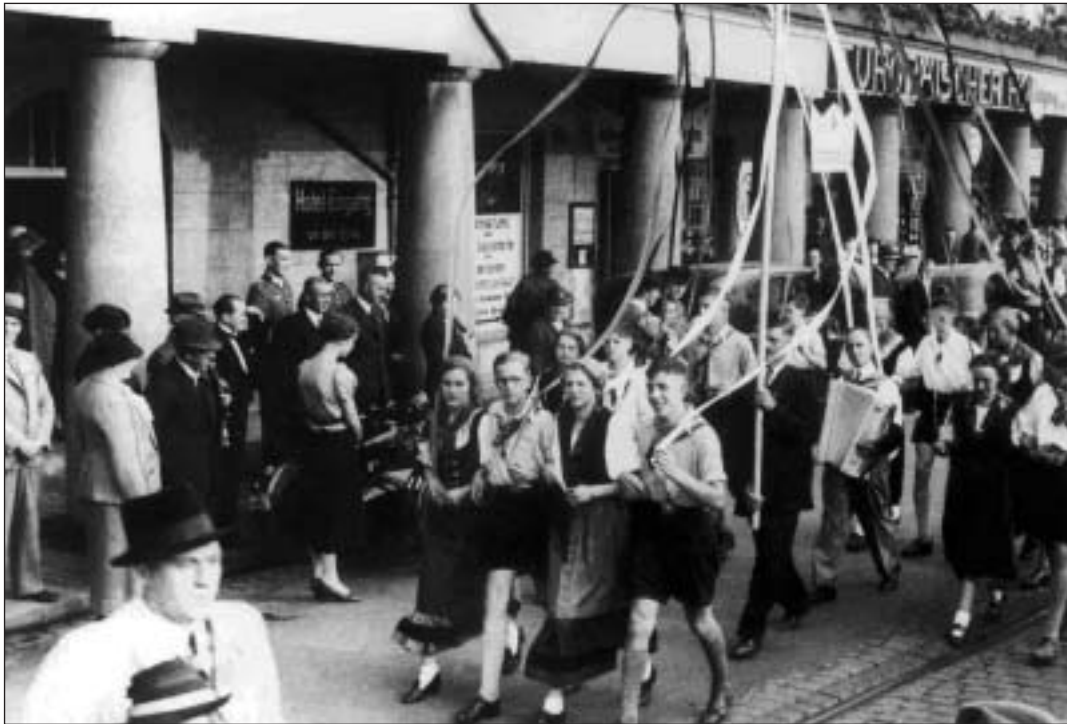
Hitler-Jugend und der Bund Deutscher Mädel beim Winzerfest 1933 in Königswinter

den Männer und gründeten die Küfer-Zunft Siebengebirge.