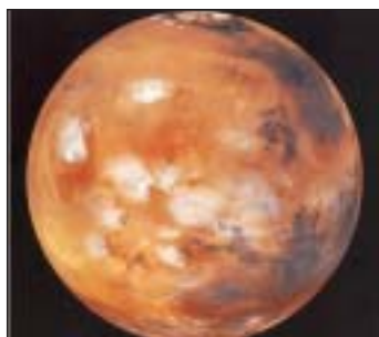
Mars, der rote Planet

Nachtschwarz ist der Himmel, die Sterne funkeln. Ein schöner Anblick – nicht nur, wenn man auf ein paar Sternschnuppen wartet, damit man einen Wunsch frei hat. Stellt Euch vor, Ihr sitzt in einer Rakete und fliegt immer höher ins Weltall. Wäre das nicht toll?