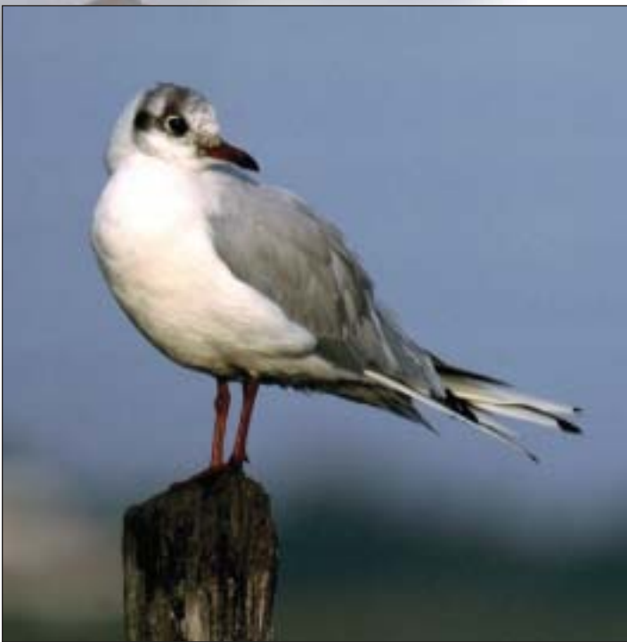
Schmucke Uferzier: die Lachmöwe am Rhein

Wer kennt sie nicht, die Lachmöwe, unsere häufigste Möwenart. Sie schmückt die Ufer des Rheins und die Landungsbrücken. Ganz besonders an grauen Tagen, wenn der Fluß eine ungewöhnlich dunkle Farbe widerspiegelt, bildet ihr leuchtend-weißes Gefieder dazu einen lebhaften Kontrast. Ihr Gekreische erfüllt die Luft und setzt dem betriebsamen Getuckere der Schiffsmotoren auch an trüben Tagen etwas Regsames, Lebendiges entgegen.