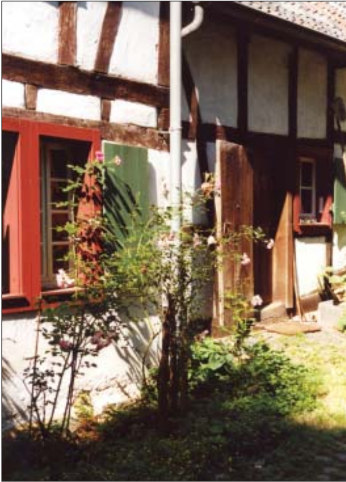
Wildromantisch: Der Eingang erinnert an längst vergangene Tage