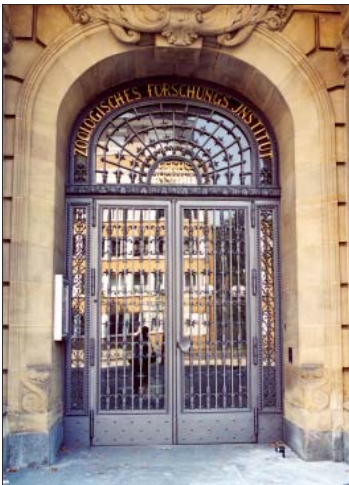
Ab 10. Oktober wieder geöffnet: Die Pforte des Museums Koenig

Endlich ist es so weit: Am 10. Oktober öffnet das Zoologische Forschungsinstitut und Museum Alexander Koenig in Bonn wieder seine Pforten für Besucher. Mehr als dreieinhalb Jahre war es wegen Renovierung geschlossen. Jetzt erstrahlen die Hallen in neuem Glanz – und bieten eine völlig neu konzipierte Ausstellung.