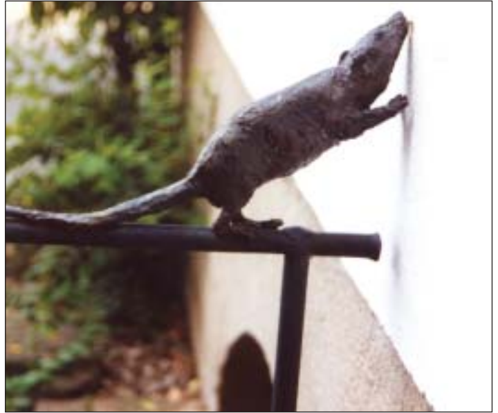
Mitbewohner? Die Ratten am Kellergeländer schuf ein Künstler

Von wann genau der Hof ist, weiß sie nicht genau – »aus dem 17. Jahrhundert«, so viel steht fest. Doch schon damals reichte