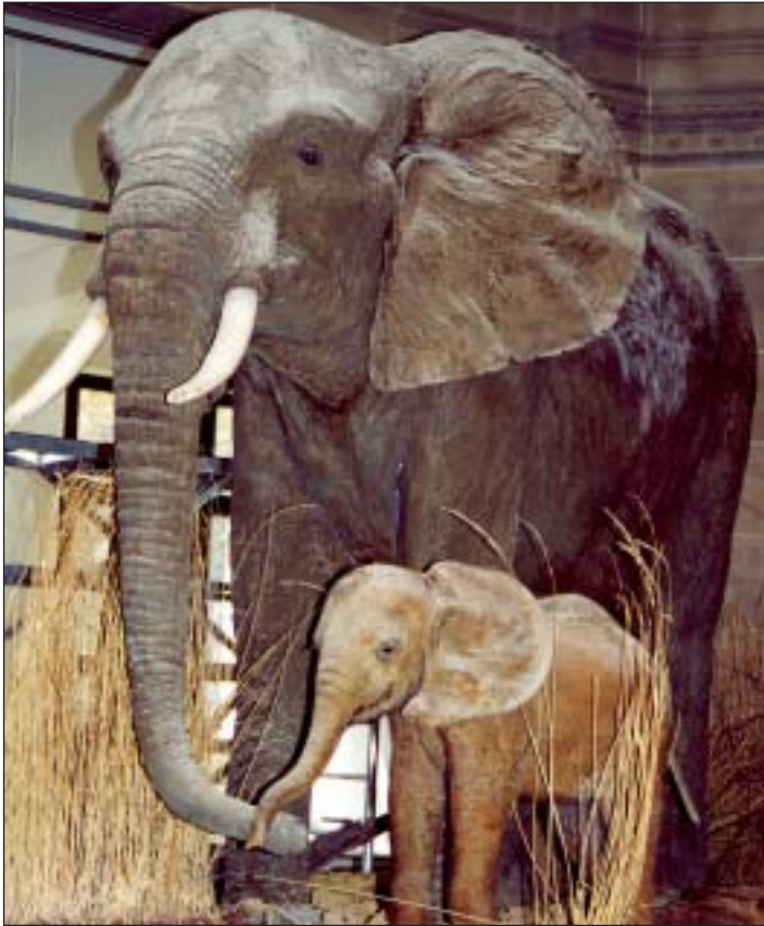
Blick in die afrikanische Savanne

hier fesseln nun thematische Schwerpunkte den Zuschauer. Zum Beispiel die Balz: »Gefallen um jeden Preis« zeigt das prächtige Federkleid verschiedener Männchen im Vogelreich. Wer trotz der neuen, frischen Präsentationen genug von ausgestopften Tieren hat, findet im Untergeschoß des Museums Abwechslung: Dort sind lebende Schlangen, Eidechsen, Warane und Geckos sowie Frösche und Kröten zu bestaunen. Und wer mal Pause machen will von der