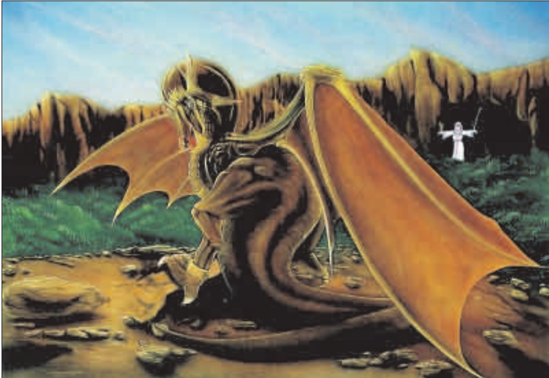
Furchterregend und blutrünstig erscheint der Drache, um sich sein Opfer zu holen

»Gnade und Mitleid? Wie soll ich Gnade und Mitleid empfinden bei all der Trauer, die mein Herz auffrißt. Er dort kennt auch keine Gnade«, entgegnete Ragnar und deutete auf die Drachenhöhle. »Aber, Mönch, wenn Ihr es schafft, den Drachen zu besiegen, dann will ich euch alle freilassen«, fügte er hinzu.