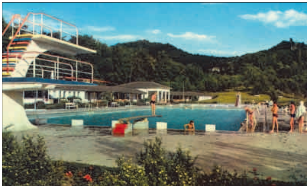
Fünf Jahrzehnte Badefreuden: Das Lemmerz-Bad in Königswinter

»Hast du dein Butterbrot mit? Und achte auf deinen Sonnenbrand!« rief mir meine Mutter noch hinterher. Doch ich hatte die Haustüre bereits zugeschlagen und ihre letzten Worte verhallten ohne Antwort im Flur. Wenn wir schon bei diesen hochsommerlichen Temperaturen hitzefrei genießen durften, galt es keine Minute zu verlieren. Für Punkt zwölf Uhr hatten sich meine Freunde mit mir im Lemmerz-Bad in der Nähe des Sprungturms verabredet. Hauptsache, ich hatte die Badehose dabei. Und ein paar Groschen für Eis sowie die obligatorische Zuckerstange durften nicht fehlen.