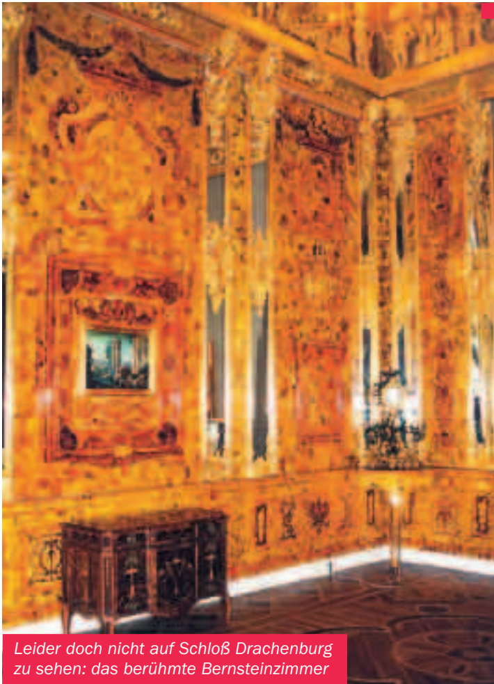
Leider doch nicht auf Schloß Drachenburg zu sehen: das berühmte Bernsteinzimmer

Beklemmende Stille in der Redaktion. Mit solch einer Reaktion hatte hier niemand gerechnet. Da schrieb uns eine große Bonner Anwaltskanzlei im besten Juristendeutsch, man sei von der Deutschen Bischofskonferenz mit der Wahrnehmung deren rechtlicher Interessen beauftragt. Wie bitte? Dort sei man entsetzt über unser Vorhaben, die einst weithin gerühmten »Stiendorfer Passionsspiele« (siehe rheinkiesel Nr. 4/1999) wieder ins Leben zu rufen. »Eine solche Maßnahme bedarf nach den gesetzlichen Bestimmungen des Rahmenabkommens der Deutschen Bischofskonferenz mit der Bundesrepublik Deutschland zwingend der Zustimmung der Röm.-Kath. Kirche« schrieb uns der Anwalt. Zuständig für diese Maßnahme sei das Erzbistum in Köln. Dorthin sei ein formloser Antrag auf Genehmigung der Passionsspiele zu richten. Im Falle der Zuwiderhandlung drohe dem Chefredakteur die sofortige Exkommunizierung durch den Klerus – so die Kanzlei.