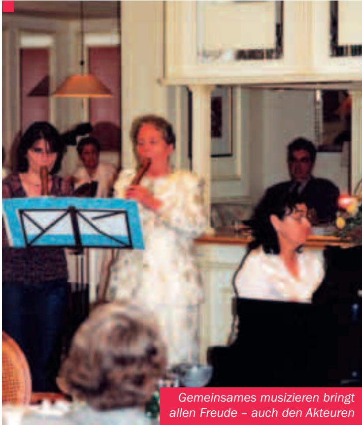
Gemeinsames musizieren bringt allen Freude – auch den Akteuren

gen, einen Beitrag zu zahlen. Auch Zimny, der selbst Klavier spielt, sieht sich nur als primus inter pares, als Ersten unter Gleichen also. In den Monaten der Vorbereitung auf ein Konzert trifft sich die Mannschaft von »New Time« insgesamt nur drei- bis viermal. Die Stücke und das Konzept werden durchgesprochen, das Programm aufgestellt. Mehr nicht. »Denn üben muß jeder selbst im stillen Kämmerlein,« erklärt der Initiator. Klavier-Duos, Flöten-Zirkel, die Zither-Spieler und alle anderen, die sich gesucht und bei »New Time« gefunden haben, treffen sich regelmäßig privat und üben. Dann treffen sie sich alle wieder zur finalen General-Probe.