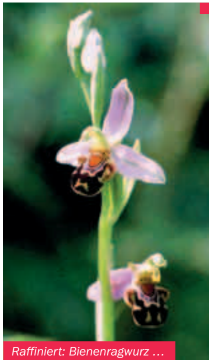
Raffiniert: Bienenragwurz ...

Anlaß ist aber nicht nur der Beginn der Blühphase, sondern die Ernennung der Fliegenragwurz zur Orchidee des Jahres 2003 durch die Arbeitskreise Heimische Orchideen in Deutschland.