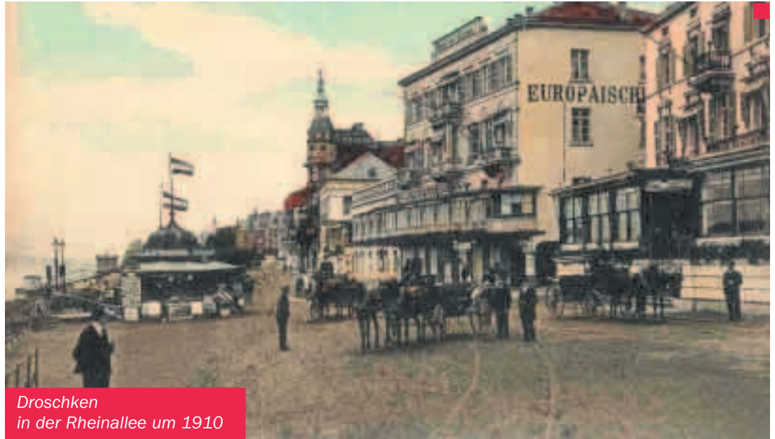
Droschken in der Rheinallee um 1910

Von der älteren Generation kennen noch viele seinen Namen. Mehrere Bücher und einige Filme erzählen seine Lebensgeschichte, darunter zwei bemerkenswerte Kinoerfolge, einmal mit Heinz Rühmann und dann mit Gustav Knuth in der Hauptrolle. Die Rede ist natürlich vom »Eisernen Gustav«, mit bürgerlichem Namen Gustav Hartmann, der auf seiner legendären Droschkenfahrt von Berlin nach Paris im Mai vor 75 Jahren auch in Königswinter umjubelt Station gemacht hat.