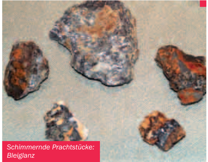
Schimmernde Prachtstücke: Bleiglanz

Kupfer- noch zahlreiche andere Erze enthielt, mußten die Metalle aufwendig voneinander getrennt werden«, berichtet Dr. Habel. »Als dann noch die Weltmarktpreise sanken, lohnte sich der Abbau in Rheinbreitbach nicht mehr; er wurde 1886 eingestellt.«