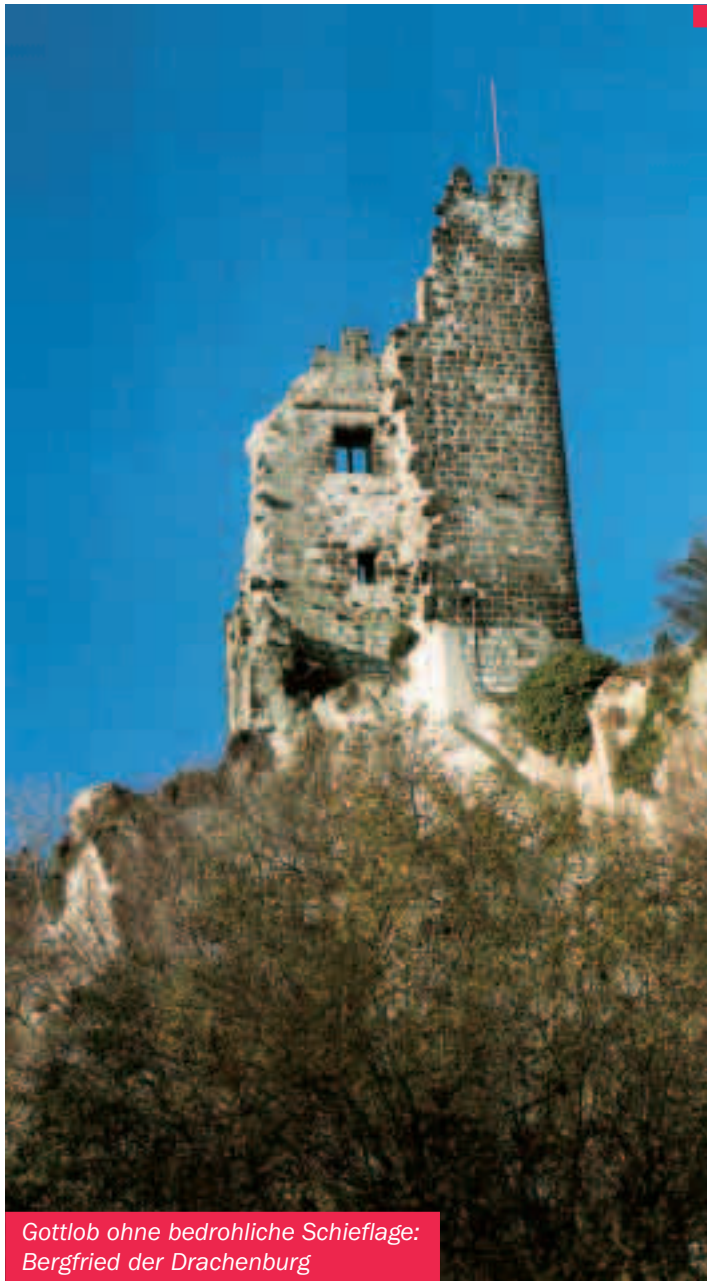
Gottlob ohne bedrohliche Schiefelage: Bergfried der Drachenburg