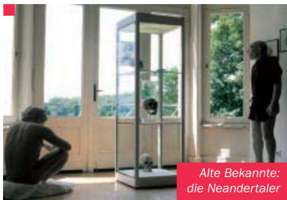
Alte Bekannte: die Neandertaler

Im Schnee steht ein Mammut. Kopf und Rücken des eiszeitlichen Rüsseltieres sind mit einer weißen Haube bedeckt. Ob es wohl friert? Oder nach Futter sucht? Wer es im Winter sieht, fühlt sich automatisch in die Zeit der frühen Menschen versetzt. Mammut Max ist das Wahrzeichen des Museums für die Archäologie des Eiszeitalters. Hinter dessen Mauern verbirgt sich eine einzigartige Sammlung der Altsteinzeit. Denn das Neuwieder Becken ist im wahren Sinne des Wortes eine wahre Fundgrube für die Altsteinzeit – die Zeit also, in der die Menschen noch Jäger und Sammler waren.