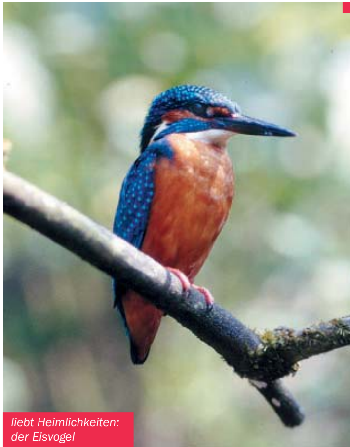
liebt Heimlichkeiten: der Eisvogel

Besonders groß ist der einem stattlichen Spatz vergleichbare Vogel ohnehin nicht. Und im Lichterspiel des Laubes lösen sich die